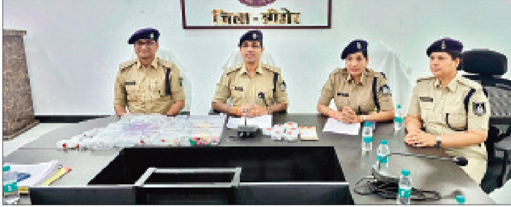
और 800 ग्राम चांदी बरामद की है। इस बड़ा सफलता हासिल की है।