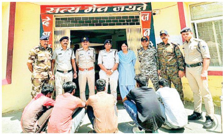
करवाए हुए हैं।

बाबा बदखसानी की दरगाह पर लग रहे 112वें सालाना उर्स में प्रतिदिन हजारों की संख्या में जायरीनों व पर्यटकों लोगों का हुजूम उमड़ रहा है। दिन के समय भले ही उर्स परिसर में चलह-पहल कम नजर आ रही लेकिन रात्रि में उर्स अपने पूरे शबाब पर लग रहा है। इसी उर्स में हजारों लोगों की भीड़ का फायदा उठाकर क्राइम करने वाले भी आ रहे हैं लेकिन मुस्तैद पुलिस प्रशासन के प्रयासों से उन्हें गिरफ्तार भी किया जा रहा है।